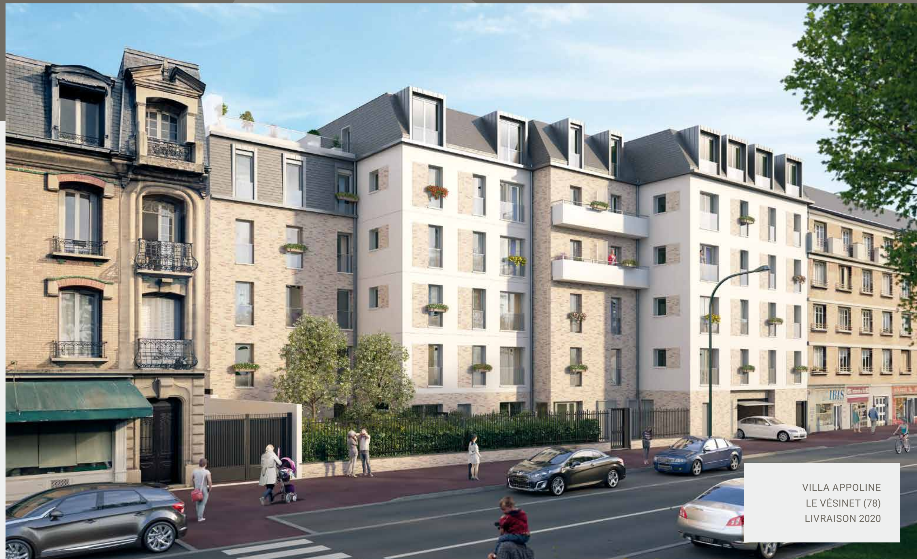
VILLA APPOLINE LE VÉSINET (78) LIVRAISON 2020

Composée d'une équipe d'experts aux compétences éprouvées en matière de promotion immobilière, cette structure à taille humaine permet de garantir souplesse, efficacité et rapidité dans tous les processus de décision. Une équipe pluridisciplinaire qui s'organise autour de 4 départements : foncier, programmes, technique et commercial/marketing.