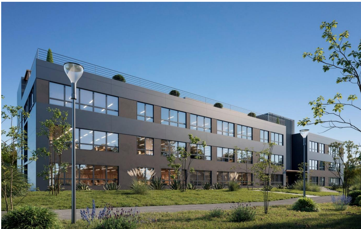
Bureaux & Co – Façade extérieure Le Calypso

C'est en périphérie de Nantes que GROUPE IDEC INVEST, investisseur du GROUPE IDEC, spécialisée dans l'investissement, et BUREAUX&CO commencent leur collaboration autour de nouveaux espaces de coworking : Le Calypso, un bâtiment déjà existant situé à Saint-Herblain, à la périphérie de Nantes.